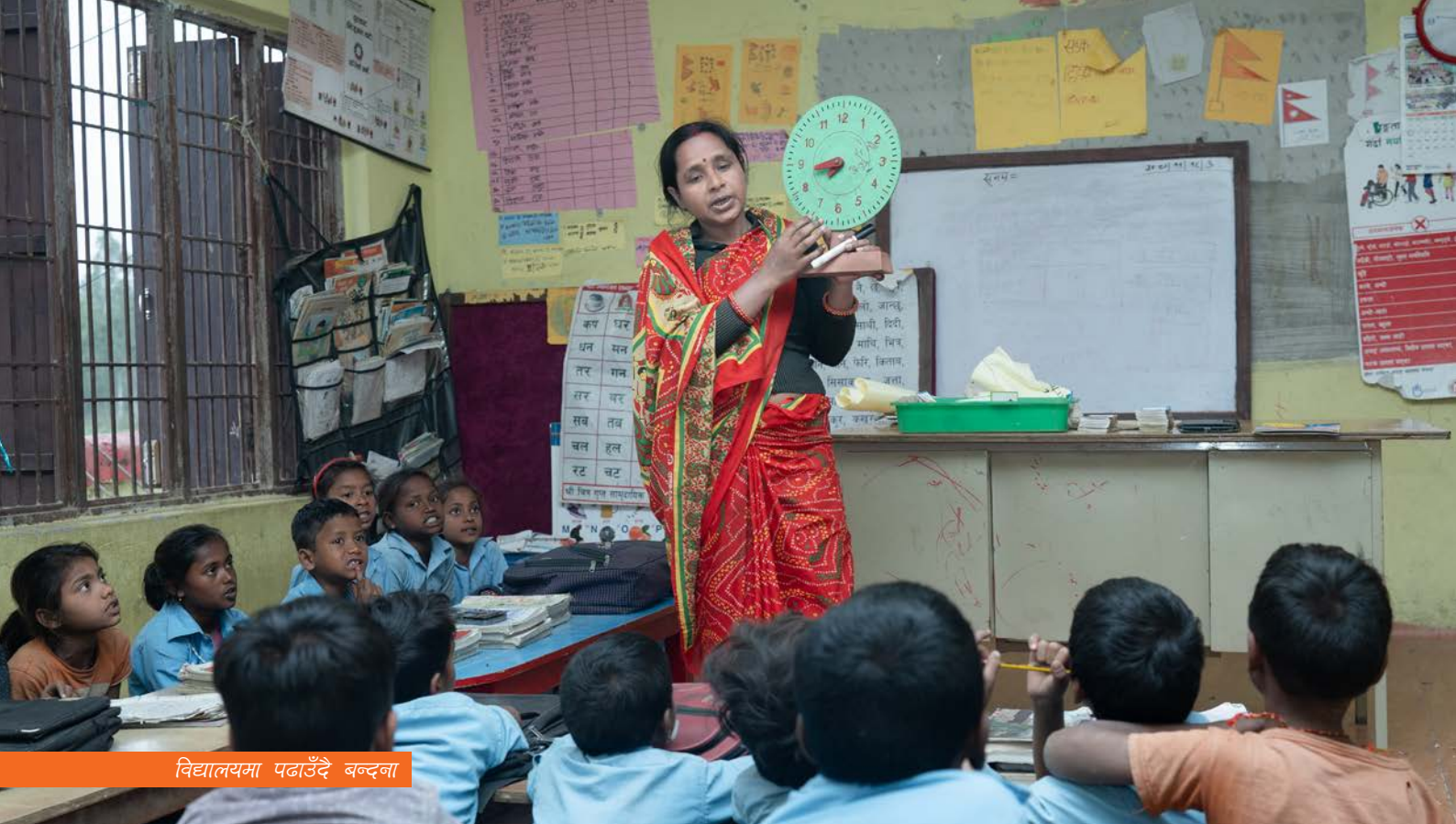
विद्यालयमा पढाउँदै बन्दना