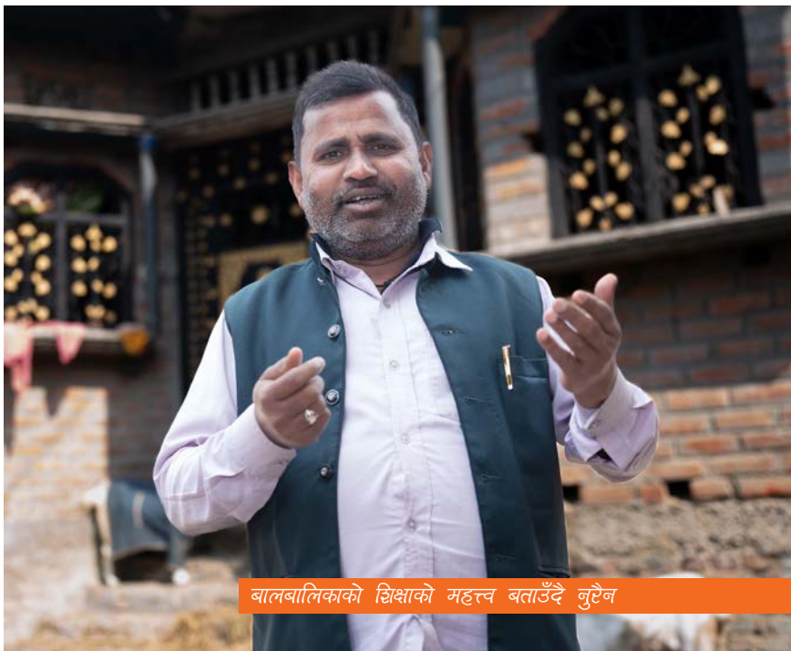
बालबालिकाको शिक्षाको महत्त्व बताउँदै नुरेन

यस परियोजनाले अभिभावक र शिक्षकहरू बिचको समन्वय सुधार गर्न पनि मद्दत गरेको छ । अभिभावकहरू अहिले आफ्ना बालबालिकाको विद्यालयमा भएको प्रगतिबारे सचेत छन् र समय समयमा आफ्ना बालबालिकाको अवस्था बुझ्न विद्यालय जान्छन् । अहिले अभिभावकहरूले शिक्षकहरूलाई पनि प्रतिक्रिया दिइरहेका छन्, जसले शिक्षकहरूलाई आफ्ना विद्यार्थीहरूको क्षमता र कमजोरीहरू पहिचान गर्न र सोही अनुसार शिक्षण तरिकामा सुधार गर्न मद्दत मिलेको छ ।