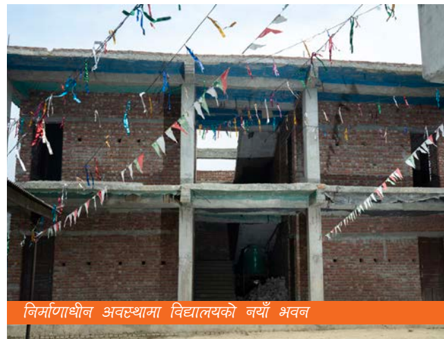
निर्माणाधीन अवस्थामा विद्यालयको नयाँ भवन

कुनै समय अव्यवस्थित प्राथमिक विद्यालय CVA समूहको पहलले अहिले उल्लेखनीय सुधार भएको छ। समूहको पहलमार्फत कसरी शिक्षामा सकारात्मक परिवर्तन ल्याउन सकिन्छ भन्ने उदाहरण प्रदान गरेको छ।