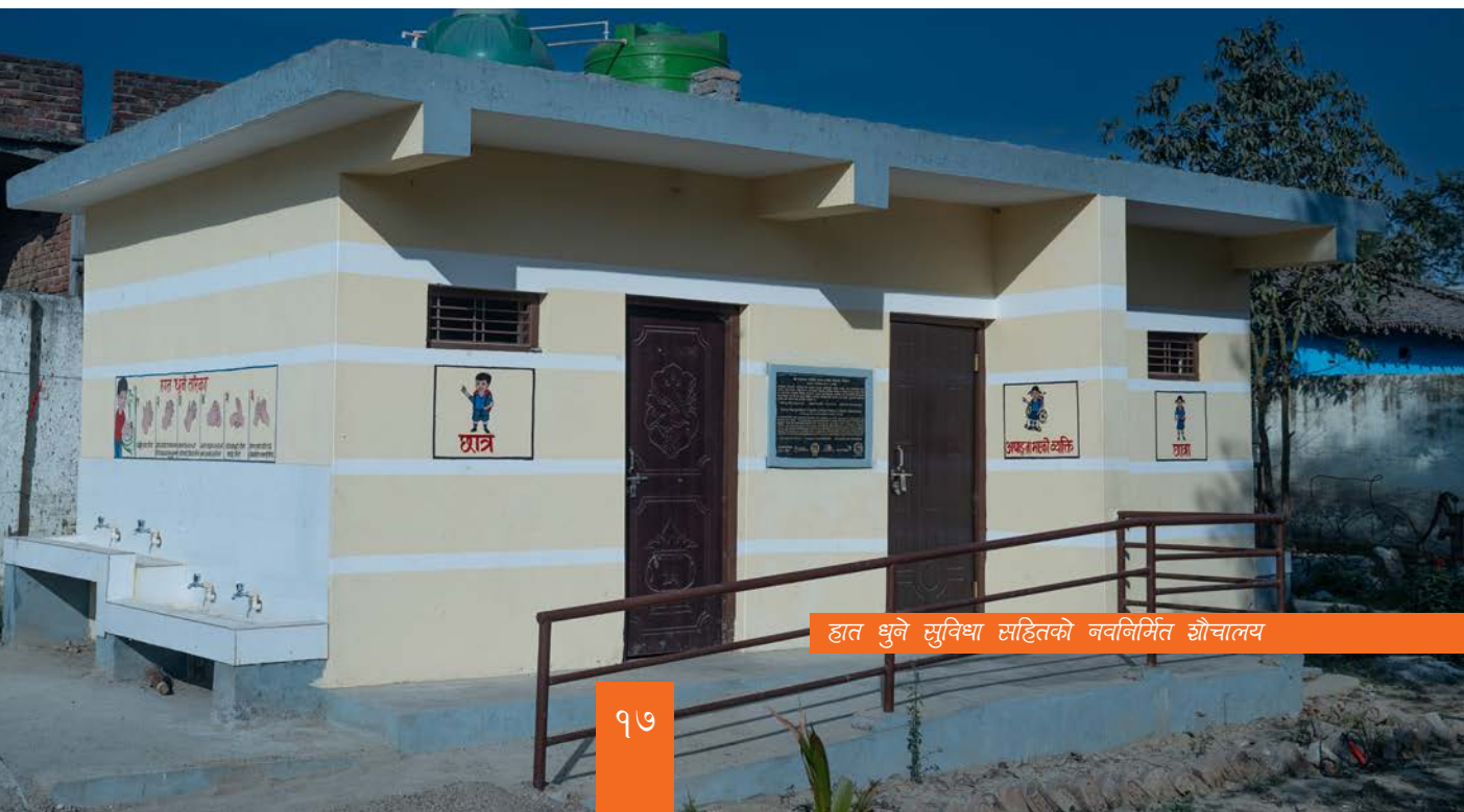
हात धुने सुविधा सहितको नवनिर्मित शौचालय

विद्यालयका भौतिक संरचना अपाङ्गतामैत्री, बालमैत्री र समावेशी भएका छन् । अपाङ्गता भएका बालबालिकाका अभिभावकहरूलाई पनि पढाउनुपर्छ, पढ्न पठाउनुपर्छ भन्ने भावनाको विकास भएको छ जसले गर्दा उपस्थितिमा पनि सुधार आएको छ । साथै परियोजनाले संचालन गरेको पढाइ सचेतना कार्यशालाले आफ्ना छोराछोरीलाई घरमा पनि पढ्ने वातावरण बनाइदिनुपर्छ भन्ने भावना जगाइदिएको छ ।