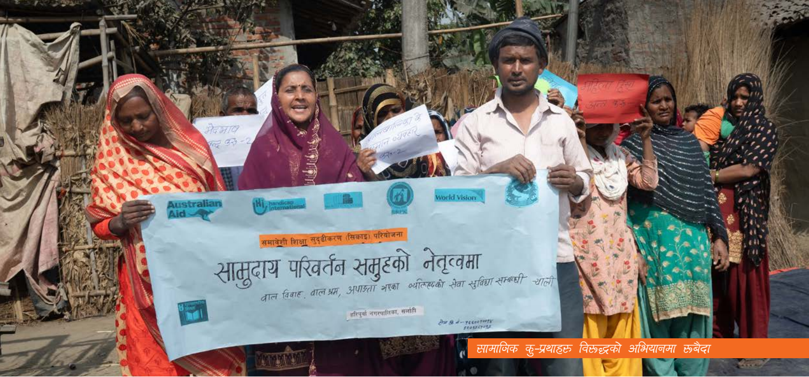
सामाजिक कु-प्रथाहरू विरुद्धको अभियानमा रुबैदा