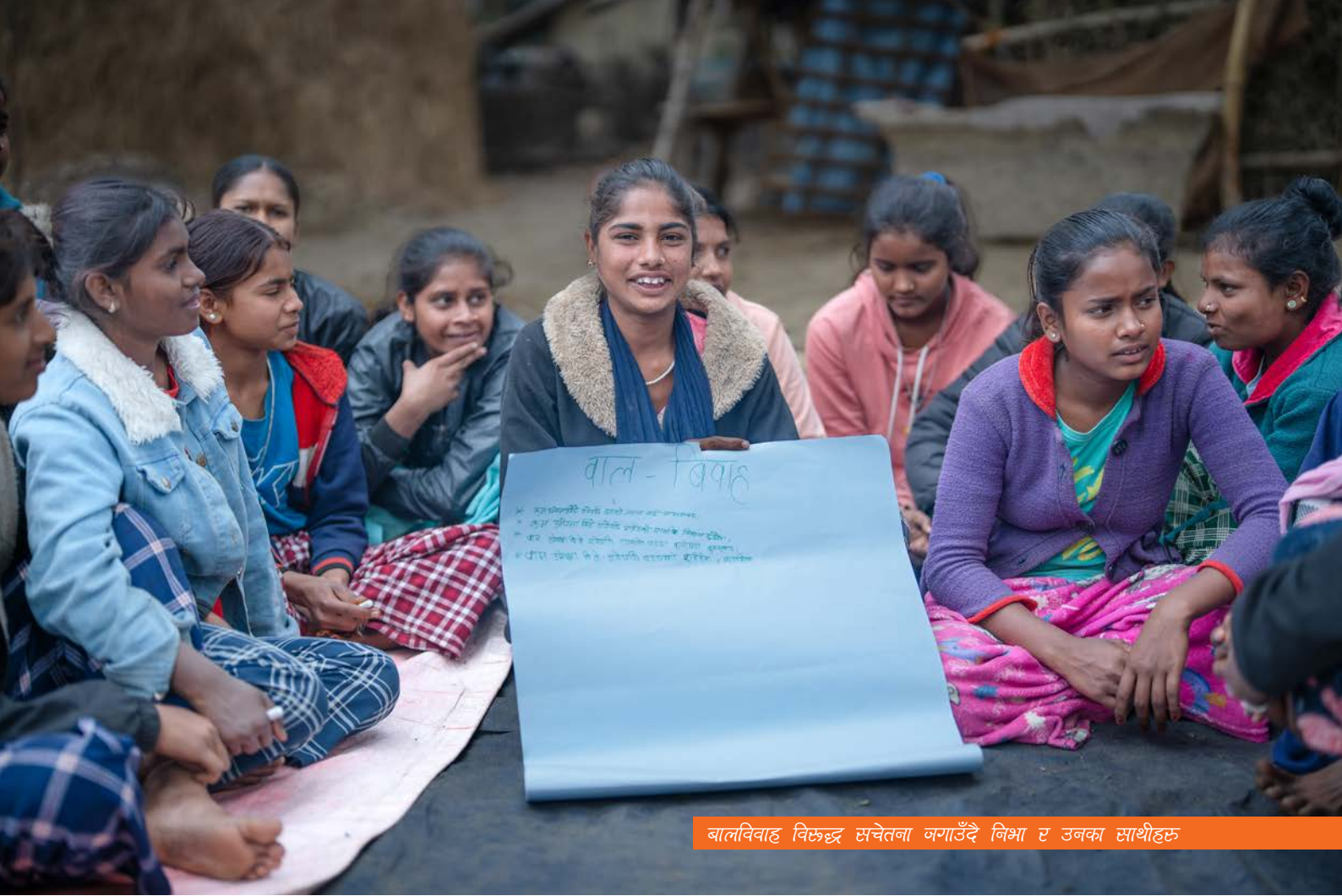
बालविवाह विरुद्ध सचेतना जगाउँदै निभा र उनका साथीहरू