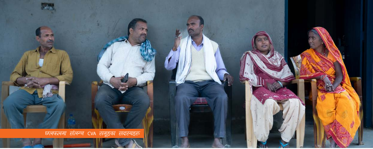
छलफलमा संलग्न CVA समूहका सदस्यहरू