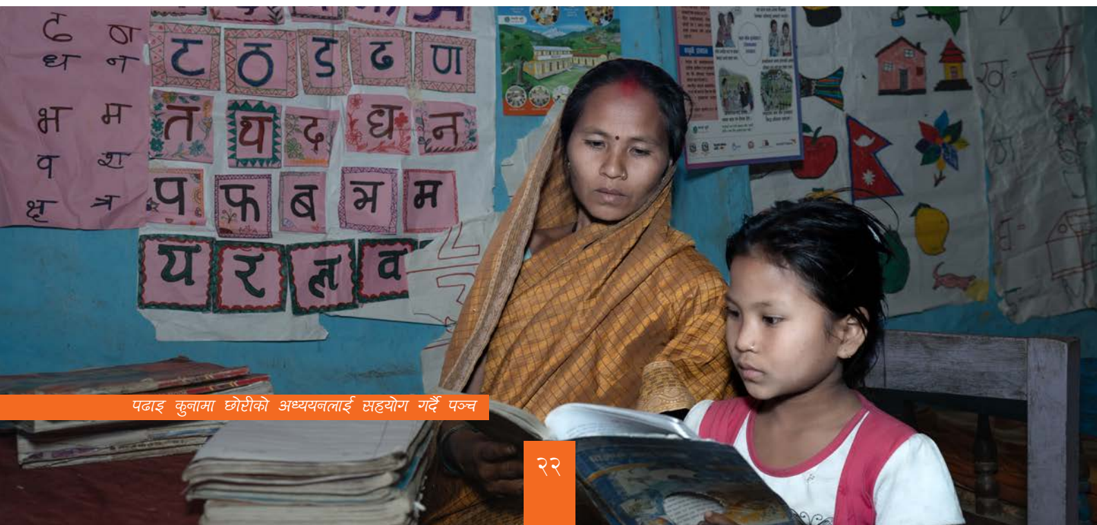
पढाइ कुनामा छोरीको अध्ययनलाई सहयोग गर्दै पञ्च

बोल्न सक्ने आत्मविश्वास र शिक्षाको महत्वको बारेमा बढेको जागरूकता नै उनको प्रगतिको प्रमाण हो । पञ्चको प्रगतिको कथाले जीवन परिवर्तन गर्न शिक्षाको महत्व झल्काउँछ ।