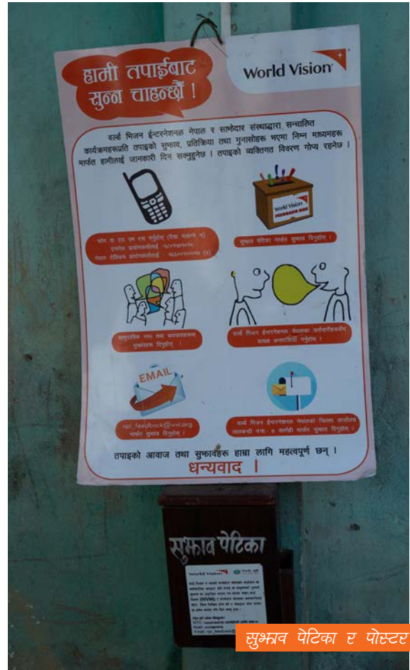
सुभाब पेटिका र पोस्टर