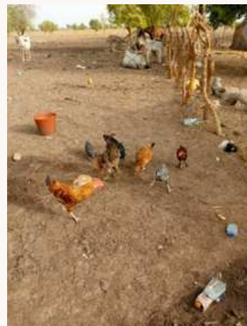
APRES FORMATION PRM