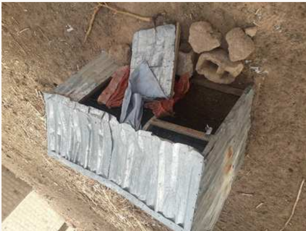
AVANT FORMATION PRM