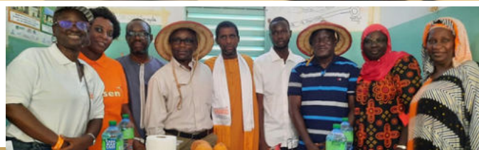
Le Directeur National de World Vision a visité les programmes de Sédhiou et Oussouye, p. 11