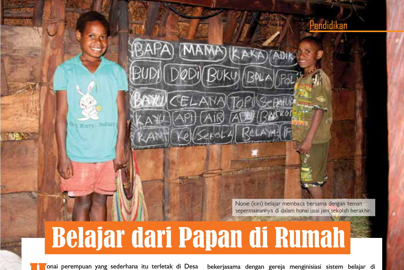
Nonie (kiri) belajar membaca bersama dengan teman sepermainannya di dalam honai usai jam sekolah berakhir.