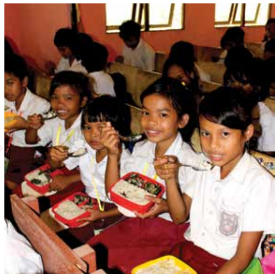
Anak-anak SD Meragun, Kabupaten Sekadau menikmati bekal makanan sehat yang dibawa dari rumah

*Penulis: Herna Sinulingga, staf Wahana Visi Indonesia Kantor Operasional Sekadau