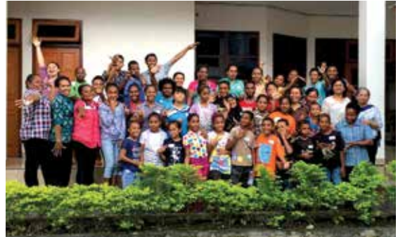
Peserta pelatihan Pendamping Anak Penyintas Kekerasan Tahap II untuk staf dan pendamping anak penyintas kekerasan

Menjadi pendamping anak penyintas kekerasan merupakan hal yang penting, mulia dan membanggakan, karena anak-anak adalah ciptaan Tuhan menurut gambar dan rupa-Nya.