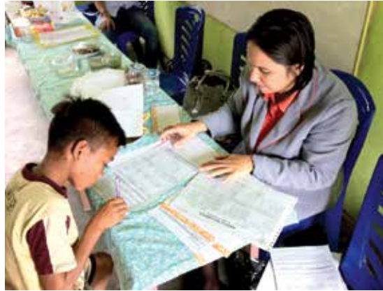
Sarlis (kiri) mengisi formulir pendaftaran tabungan pendidikan di depan petugas bank yang datang ke desanya.