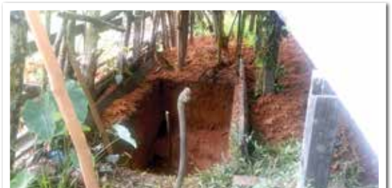
Warga Desa Pelempai Jaya, di wilayah Kabupaten Melawi, mulai sadar untuk membangun WC di rumahnya

*Penulis: Niken Onggosandojo, staf Wahana Visi Indonesia Kantor Operasional Melawi, Kalbar