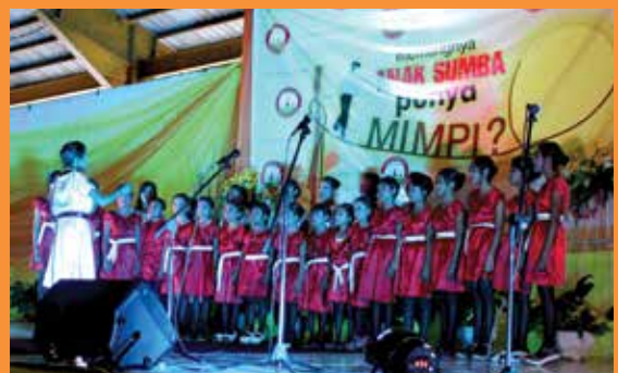
Na Anamu Choir menyanyikan lagu Darah Indonesia dengan apik.

Na Anamu Choir, grup vokal anak-anak berbakat dari Sumba Timur, kemudian membawakan lagu berjudul Darah Indonesia dengan apik.