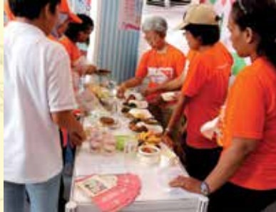
Para kader Posyandu siap memberikan informasi terkait dengan pemberian Makanan Pendamping ASI.