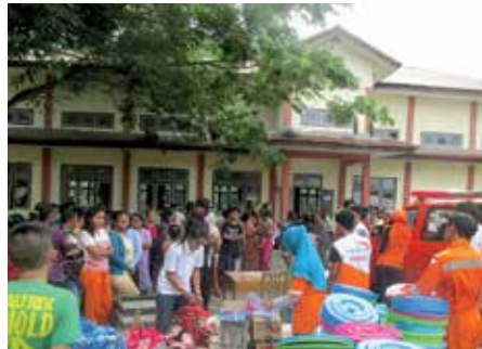
WVI memfasilitasi kegiatan menggambar bagi anak-anak yang tinggal di pengungsian setelah Gunung Gamalama meletus.

W ahana Visi Indonesia (WVI) Kantor Operasional Ternate menyalurkan paket bantuan bagi 114 keluarga di Desa Loto hari Rabu (22/7) dan akan terus mendistribusikan 146 paket keluarga bagi pengungsi lain di desa itu hari ini.