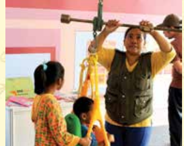
Di Wahana Perjalanan Kehidupan, pengunjung juga bisa memantau pertumbuhan anaknya, antara lain dengan menimbang berat badan.

W ahana Visi Indonesia mendorong terpenuhinya pemenuhan gizi anak selama 1000 Hari Pertama Kehidupan dengan melakukan kampanye Aksi Gizi di Monumen Nasional (Monas) Jakarta, Minggu (10/5). Kampanye ini dilakukan dengan mengajak para pengunjung Monas menyusuri Wahana Perjalanan Kehidupan untuk menyusuri perjalanan 1000 Hari Pertama Kehidupan (HPK) manusia, terhitung sejak janin di dalam kandungan hingga usia dua tahun.