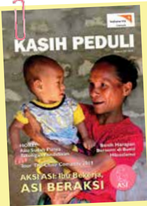
Ibu dan anak Sumba Barat Daya