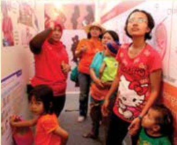
Pengunjung Wahana Perjalanan Kehidupan mendapatkan penjelasan tentang bagaimana menjalani hidup sehat.