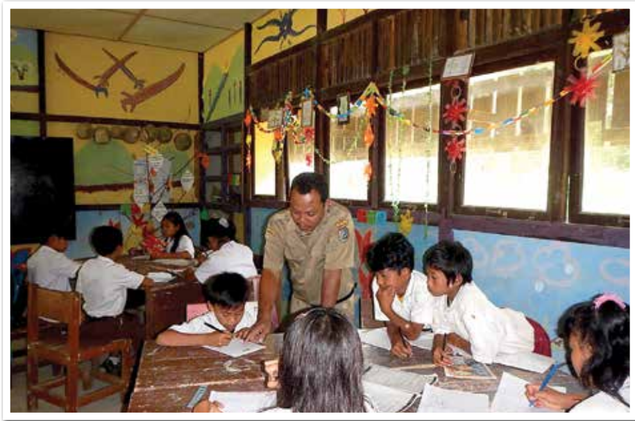
Warna-warni dekorasi kelas di SDN 05 Angan Tembawang membuat murid-murid bersemangat dalam belajar.